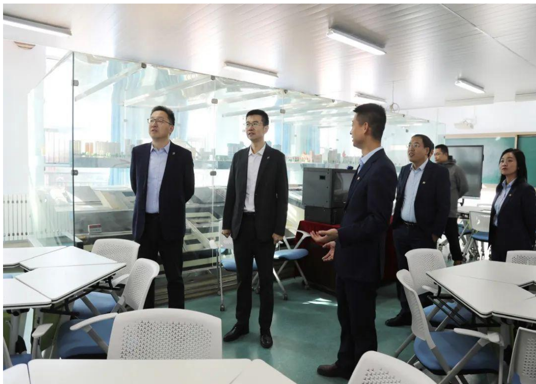
图 6-1 校企合作情况

这一创新举措，以政校企深度携手为基石，重塑了人才培养的新模式。在招生机制上大胆革新，精准定位有志于采矿行业的学子，同时辅以极具吸引力的助学激励措施，既点燃了本地学生追求知识与技能的热情，又为他们开辟了通向广阔未来的就业通途。“力量班”精心设计的工学交替培养模式，恰似一把神奇的钥匙，开启了理论与实践紧密融合的大门。学生们在校园中，沉浸于专业知识的浩瀚海洋，夯实基础；在企业的实习岗位上，亲身体会采矿作业的每一个环节，积累宝贵的实践经验。如此一来，不仅能精准对接准格尔旗采矿企业对专业技术人员的急切需求，还为行业的可持续发展注入了源源不断的新鲜血液，成为职业教育与地方产业双元育人发展的成功典范。