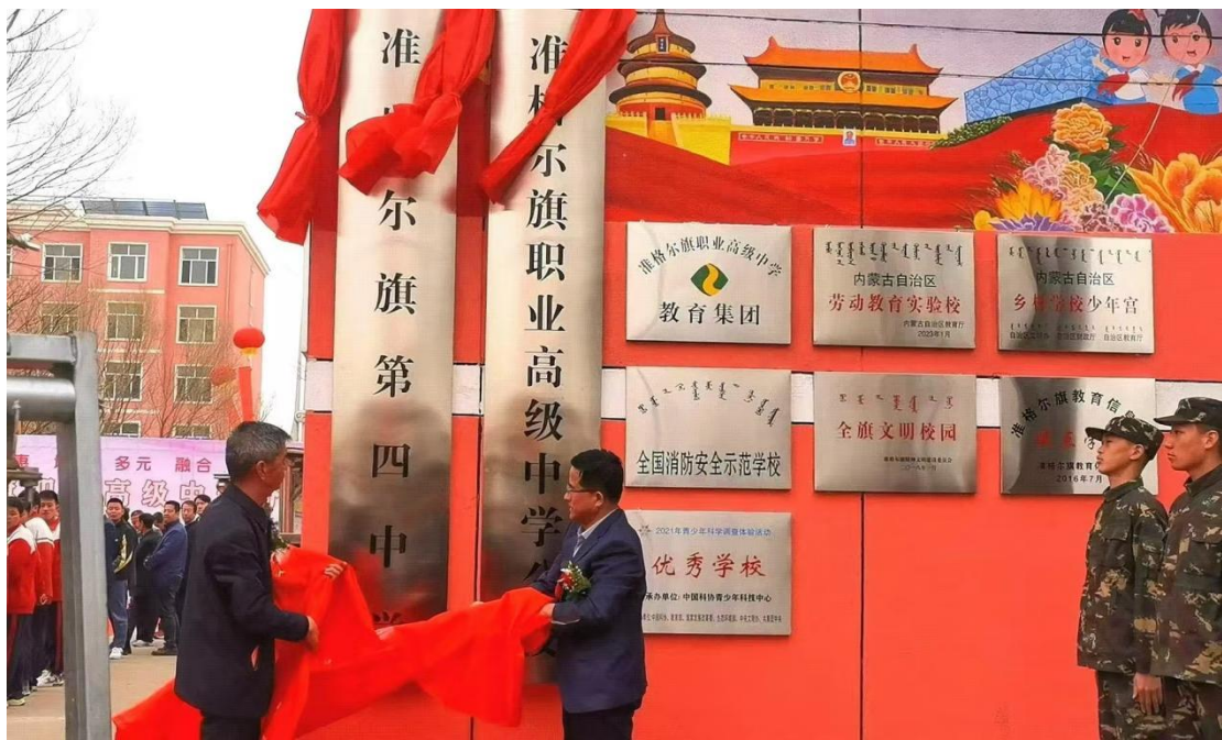
图 6—2 集团化办学成立仪式

党的二十大报告指出：“统筹职业教育、高等教育、继续教育协同创新，推进职普融通、产教融合、科教融汇，优化职业教育类型定位”。成立了准旗职业高级中学教育集团，将准四中（柴登希望小学）设置为准职中分校。对教育集团内的教育资源进行整合、优化，最大限度地共享师资、管理、文化等资源，充分发挥总校资源优势，实现集团化办学效益最大化。一是创建以“劳动教育、准军事化管理、科技创新”为抓手的素质教育特色校；二是推进产教融通、产教融合、科教融汇，进一步提升教育集团综合办学水平；三是通过发挥准职中的品牌效应和示范引领作用，激发办学活力，以学分银行信息化为载体、全面落实“三全育人”目标。