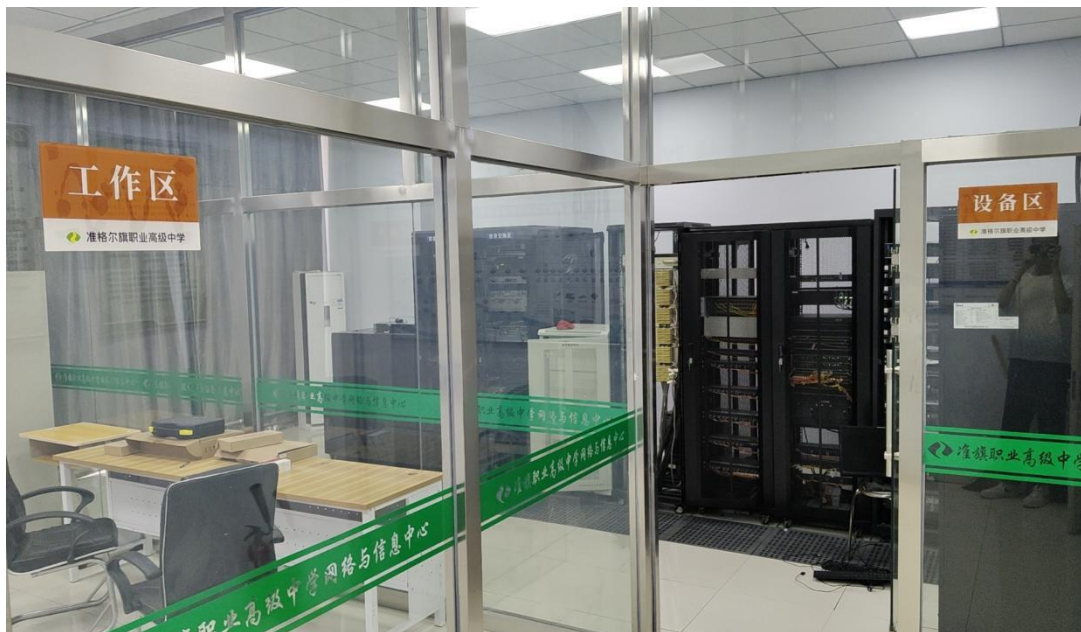
表 2-1 为准职中数据中心图片

学校始终秉持应用为王、服务至上的核心理念，坚定不移地大力推进信息化建设进程，成效显著。在管理维度，精心打造校本数据中心，全力整合各类繁杂数据，通过深度挖掘与精准分析，为学校的管理决策层提供科学、精准且极具前瞻性的依据，助力学校管理效能的飞跃。于服务层面而言，一卡通等便捷平台的建设与完善，实现了校园生活消费、门禁出入、图书借阅等多功能一体化，极大地便利了师生的校园日常，提升了校园生活的幸福感与舒适度。聚焦教学领域，智慧教学平台的广泛应用丰富了教学手段，资源库中浩如烟海的优质资源为教师教学提供了坚实后盾，虚拟仿真技术更是让抽象知识具象化，使教学过程更加直观、生动，有效激发了学生的学习兴趣，显著增强了学习效果。而在评价体系构建上，充分借助数据中心和教学平台积累的海量数据，对教学成效、学生学习动态及日常综合表现进行全面、客观且科学的评价诊断，精准发现问题与优势，进而以评促教、以评促学，有力推动学校教育教学质量持续攀升，迈向新的高峰。