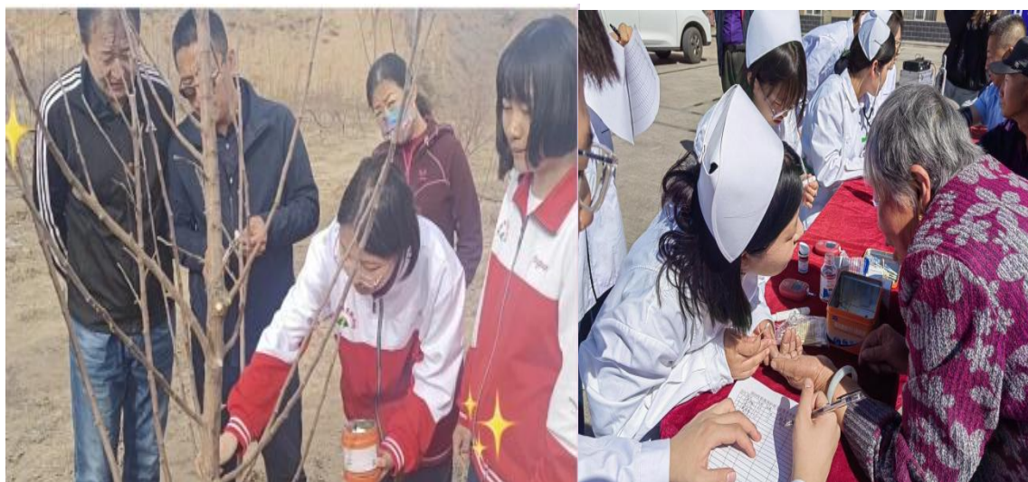
图 4—3 师生社会服务活动

教师带领学生组成志愿服务队，深入乡村开展教育帮扶活动。针对乡村学校师资力量薄弱的问题，志愿者们发挥师范专业优势，为孩子们带来生动有趣的课程，例如音乐、美术、体育等，丰富乡村孩子的学习生活，并激发他们的学习兴趣。农学相关专业的师生们则运用专业知识为乡村农业发展提供技术支持。他们深入田间地头，为农民讲解农作物种植、病虫害防治等知识，指导农民科学种植，提高农作物产量和品质。此外，学校还定期举办农业技术讲座，发放农业技术资料，帮助农民掌握先进的农业技术，提升农业生产水平。护理专业的师生则定期为乡村居民提供免费的医疗服务。他们开展健康体检、疾病预防知识宣传等活动，为村民们的健康保驾护航。