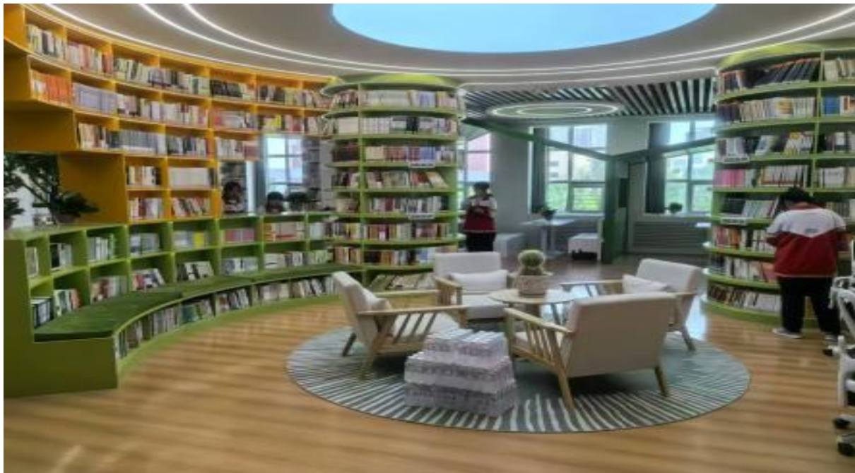
图 1—1 准职中图书阅览室