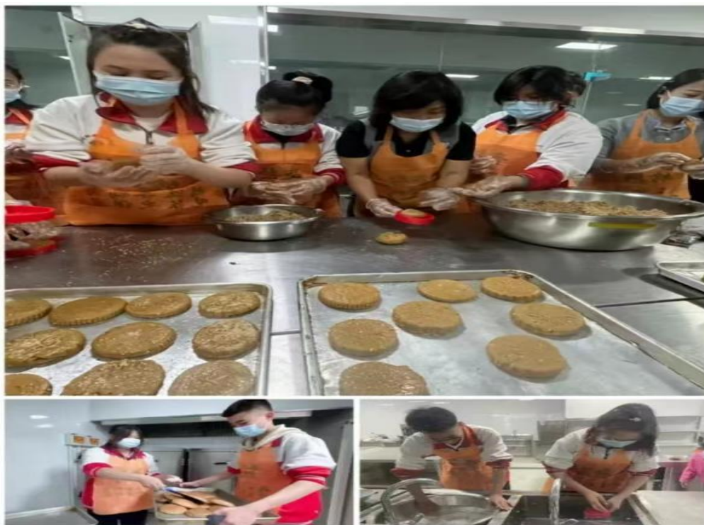
图 4—1 师生中秋节活动

每年开展以“传统文化”为主题的系列文化活动，将课堂学习与体验式实践相结合。通过探索节日起源、象征意义和习俗，引导学生深入理解传统文化背后的智慧，领悟节日中的道德价值和人生哲理，塑造正确的价值观、行为准则和文化认同。策划沉浸式节日体验项目，让学生身临其境地感受中国传统节日的魅力，体会自然变化与生活规律的紧密联系。例如，在“立春”时节，组织“迎春接福”活动，学生亲手制作春联、剪纸，感受传统文化的魅力，“端午节”组织学生包粽子，亲身体会端午习俗，学习屈原的爱国精神，“中秋节”组织学生到敬老院开展慰问活动，与老人们一起品尝月饼、赏月，并讲述中秋节的传说故事，让学生们在体验中感受传统文化的温暖和亲情。