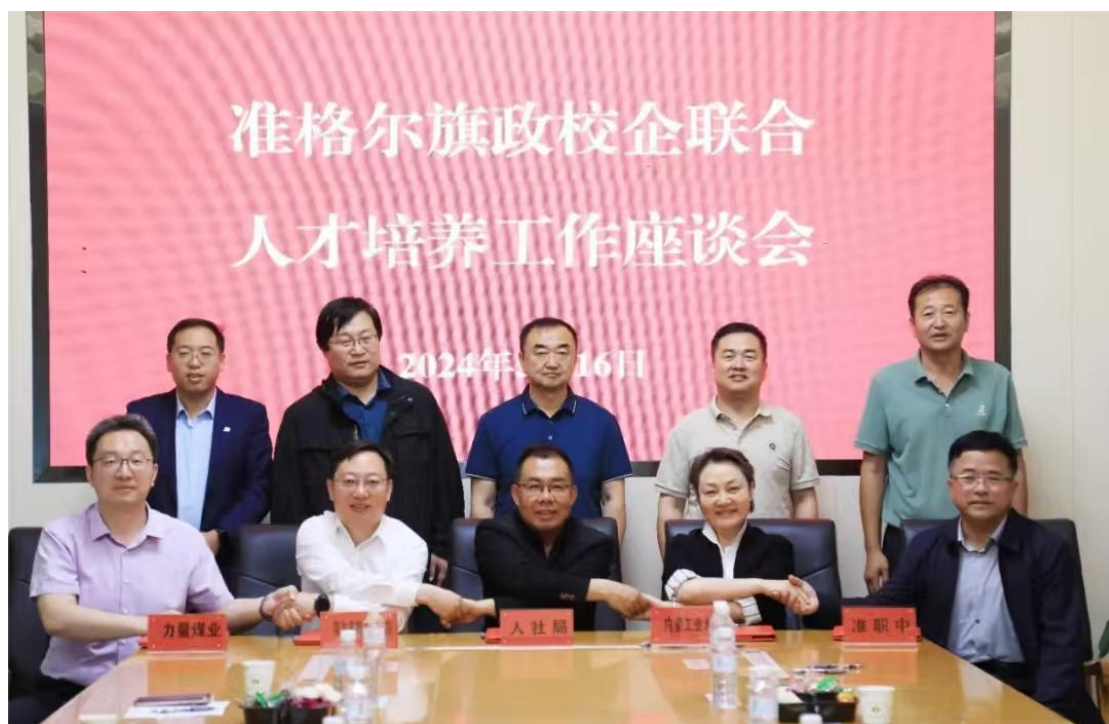
图3—1 政校企联合培养“力量班”工作洽谈

大力推进“院校企”订单式培养模式，逐步构建起极具特色的人才培养体系。与准格尔旗力量煤业有限公司携手开展的“力量班”订单培养项目，以及和其子公司准格尔旗量蕴农牧业发展有限公司共建的“量蕴班”，精准对接企业需求，为学生提供了明确的职业导向。在校企双向交流机制方面，学校聘请了48名企业技术技能人才到校任教，他们将丰富的实践经验和前沿技术带入课堂，使教学内容更贴合实际工作场景。同时，95名专业教师深入企业实践，及时了解行业动态，更新知识储备，从而在教学中更好地传授实用技能。凭借在产教融合领域的积极作为，学校荣升为全国机器人和智能制造行业产教融合共同体副理事长单位，并成功加入8个自治区级行业产教融合共同体，这不仅提升了学校在行业内的影响力，更为学生搭建了更广阔的就业与发展平台，促进了教育资源与产业资源的高效整合与优化配置，源源不断地为相关行业输送高质量专业人才，有力推动地方经济与产业的协同发展。