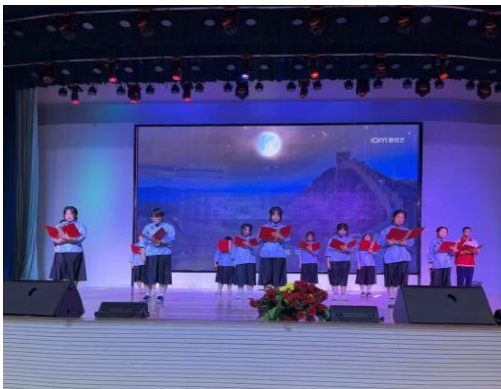
图 4—2 红色经典朗诵活动

在实践教学中，将理论与实践相结合，在主题班团会和主题升旗开展“延安精神”“长征精神”等理论学习、在重要纪念日开展大型红色主题活动，“七一”建党节举行“红心向党，青春逐梦”演讲比赛，学生们从党史感悟出发，结合自身成长规划，立誓以青春报效祖国；国庆前夕举办“红色记忆，盛世华章”书画展，一幅幅笔触稚嫩却饱含深情的画作、书法作品，描绘祖国山河、革命征程，抒发爱党爱国热忱。