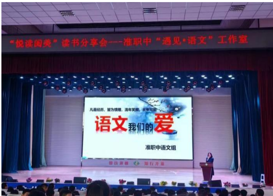
图 4—4 师生书香校园活动

我校的书香校园活动精彩纷呈。通过读书分享活动，学生畅谈读书感悟，交流思想，提升阅读与表达能力。通过书法培训和书法比赛，笔锋游走间尽显文化底蕴，墨香满溢校园。护理专业知识手绘活动，学生以绘画、手工等形式诠释“书香与艺术的碰撞”，附创意说明，佳作展示激发创新思维，丰富校园文化。各项活动相辅相成，共筑浓郁书香氛围，促进学生全面发展。